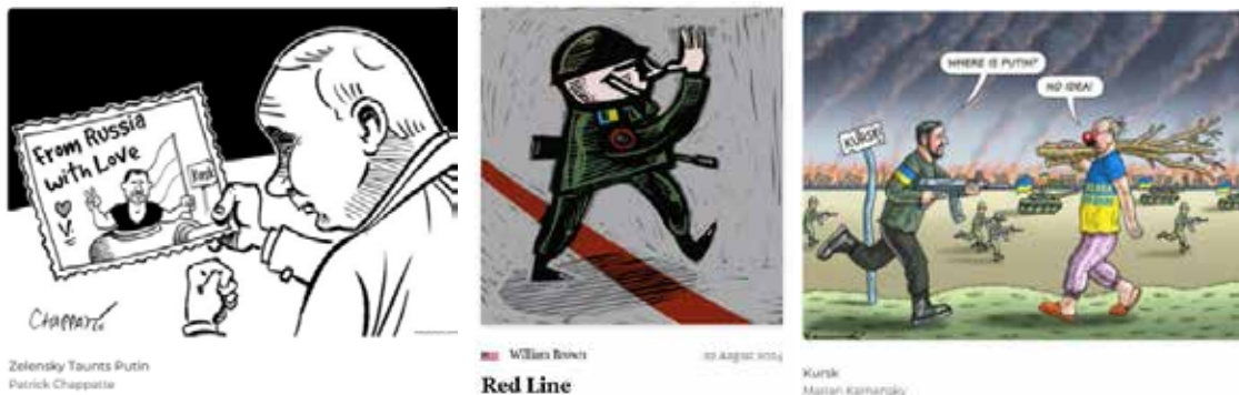
Рис. 4. Насмішка над Росією та її лідером

Друге зображення з «Political Cartoons» демонструє ведмедя у військовій шапці з кокардою у вигляді триколову. У горлянку звіра стирчить основа розташованої у Києві монументальної скульптури «Батьківщина-Мати», інша сторона якої вийшла з його лівого боку. На відміну від оригіналу у руках Батьківщина-Мати замість меча тримає жовто-блакитний стяг, додатково нагадуючи про напрям, звідки завдано удару. Характер