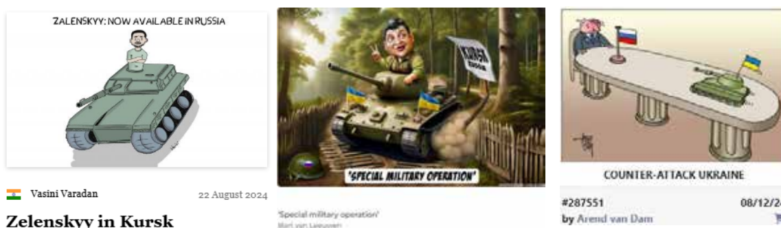
Рис. 1. Українські війська в Курській області

Друга категорія проаналізованих карикатур, окрім прямого й очевидного факту контратаки українських військ, додатково характеризує її як успішну, неочікувану і блискавичну (рис. 2). Представлені для аналізу зображення з «Political Cartoons», «Cartoonstock» і «Cartoon Movement», окрім інформативної, очевидно, мають емоційно-оцінну функцію за посередництвом комічності представлених ситуацій та образів. На першій карикатурі змальовано ситуацію, де танк з українським прапором, з якого видніється голова, очевидно, президента України, блискавично проскакує поміж ніг велетенського розміру персонажу, схожого на Володимира Путіна, який із ракетою в руці стоїть на сторожі своїх володінь, обнесених трухлявим парканом. Обшарпана огорожа й розі-