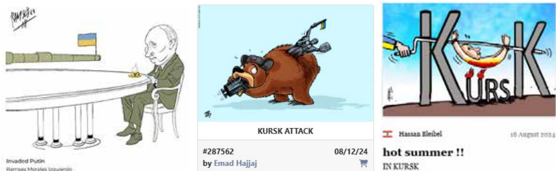
Рис. 5. Загроза існуванню російської федерації

та розмір поранення вказують на наближення сумного фіналу для тварини.