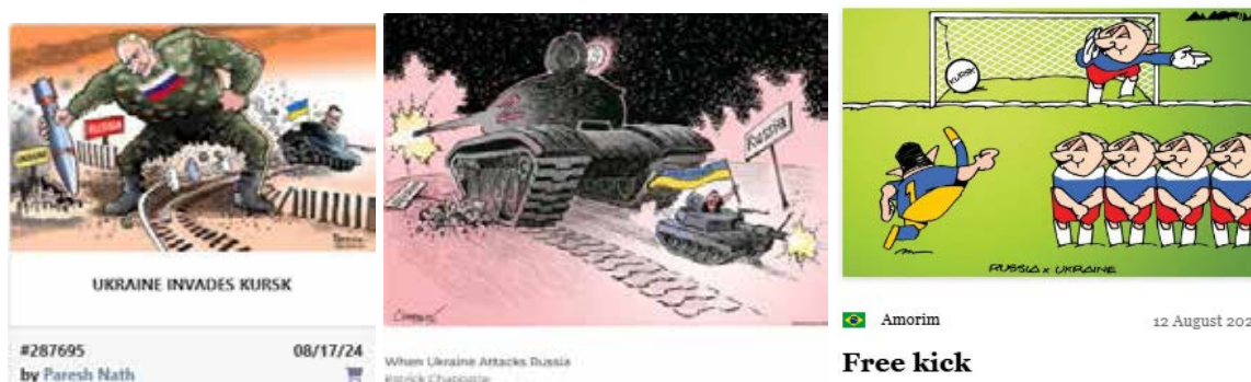
Рис. 2. Курська операція – блискавичний військовий маневр