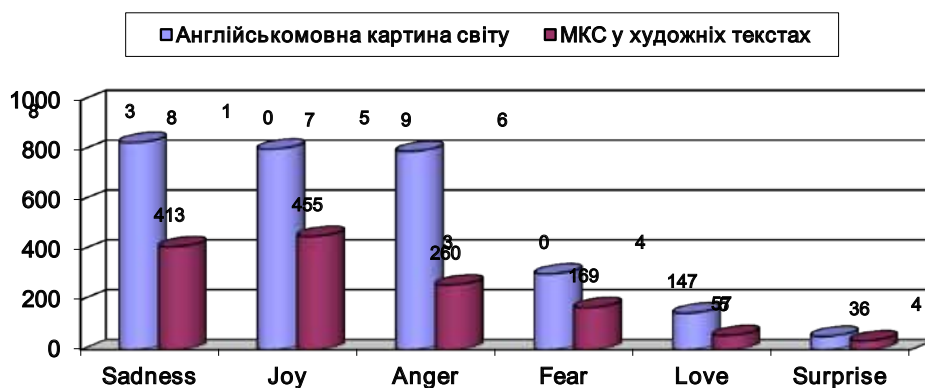
Рис. 2. Порівняльний розподіл складників ЛСП емотивних прикметників

well, and then he'll settle down to be happy too. Now wonderful love is, the most wonderful thing in the whole world... We were both breast-fed babies with happy childhoods. It does make a difference. I think being good is just a matter of temperament in the end. Yes, we shall all be so happy and good too. [7, с. 65].